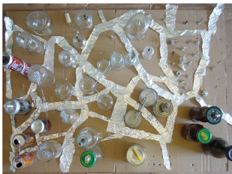
La città di vetro e metalli