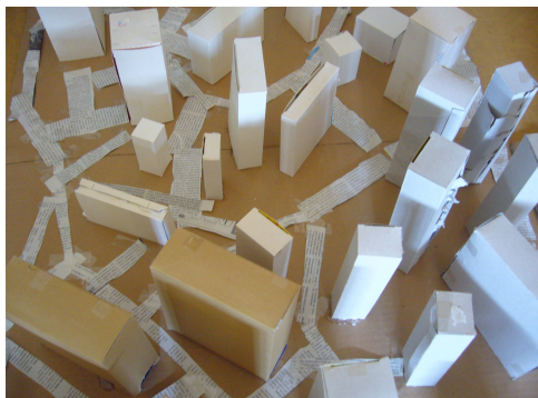
La città di carta e cartone